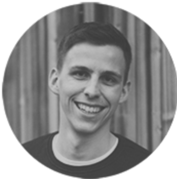
Nicolas Gantenbein Événements