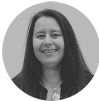
Anne Hirel Presse & partenariats